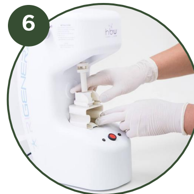
6 PREPARATION Centrifugation du prélèvement et preparation des cellules souches