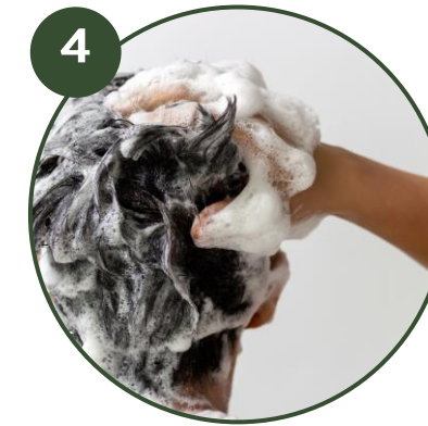
4 PREPARATION Shampooing détox