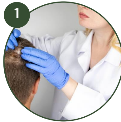
1 CONSULTATION INITIALE Examen clinique et plan de traitement