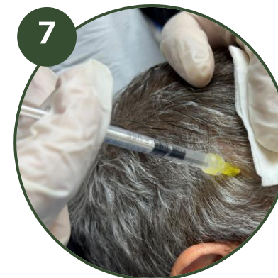
7 INJECTION DES CELLULES SOUCHES Injection à l'aide d'aiguilles de mésothérapie