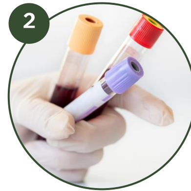
2 ANALYSES PRE-OPERATOIRES Bilan sanguin (sur ordonnance)