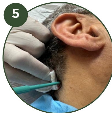
5 PRELEVEMENT GREFFONS Anesthésie Prélèvement greffons