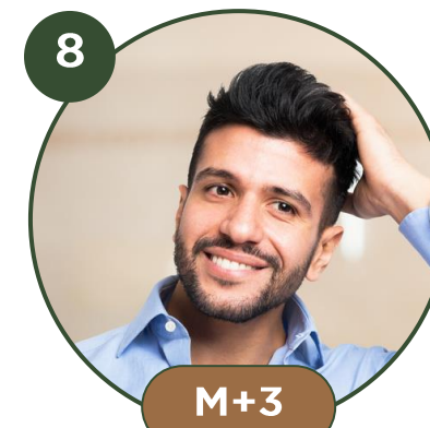
8 SUIVI POST-OPERATOIRE RDV avec le praticien à M+3 et M+12

NOUS SOMMES A VOTRE DISPOSITION POUR REpondre A VOS QUESTIONS