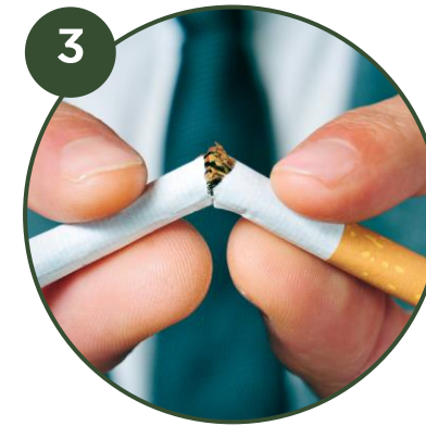
3 SOINS PRE-OPERATOIRES STOP stimulants (café, thé, alcool, tabac) Shampoings détox